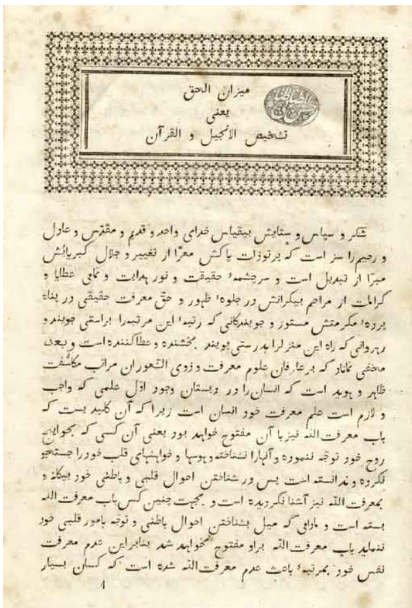
تصویر ۵- صفحه ۱ از کتاب میزان الحق، چاپ سنگی ۱