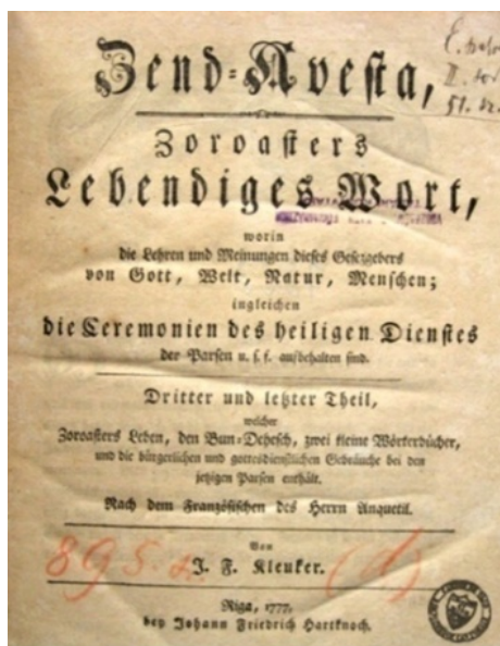
تصویر ۳- صفحه عنوان زند - اوستا ۱