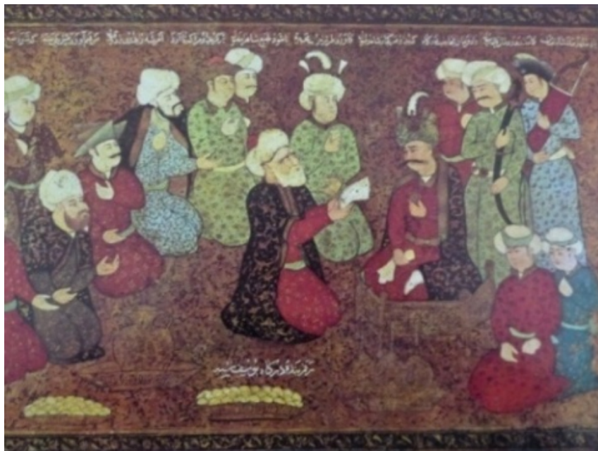
تصویر ۲- شرفیابی نماینده آلمان به حضور شاه عباس (درب صندوقچه) ۱

روابط فرهنگی ایران و آلمان از عصر صفوی تا پایان دوره قاجار ۱۲۷