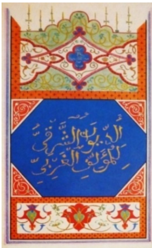
تصویر ۴- دیوان غربی - شرقی، ۱۸۱۹. موزه گوته - دوسلدورف ۲